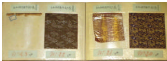
Cahier d'échantillons de tissus.

classiques (armes, statuaire, ivoires) voisinent avec des objets plus modestes, avec parfois une tentation typologique. Ainsi, les tsubas qu'il collecte ne sont pas des pièces décoratives mais des gardes en métal simple, très géométriques, usées et patinées. Il s'intéresse également beaucoup aux textiles, avec des visées commerciales.