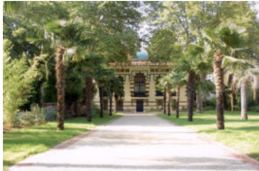
Vue du musée depuis le jardin.