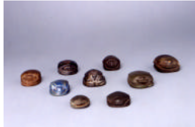
Scarabées, Égypte.

l'ethnologie. Les plus anciennes collections d'étude du musée reflètent ainsi une lente évolution de l'étude typologique simple de certains objets, à une prise en compte de plus en plus marquée de leur contexte de création.