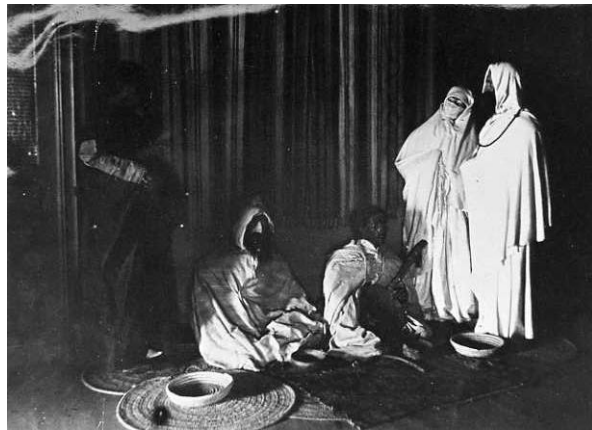
Vue d'une présentation du musée.

L'aménagement intérieur du musée en 1894 en témoigne : dans la coupole en salon oriental, à l'étage les collections rassemblées par pays, au rez-de-jardin des reconstitutions de scènes (9 groupes de personnages représentant le Japon, la Chine, la Corée, la Grèce, la Turquie, l'Afrique, l'Île de Ré, Luchon, la vallée de Bethmale).