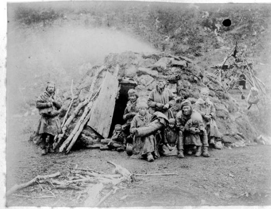
Habitation en Laponie.

trouvé par un corps expéditionnaire en 1862. Ces statuettes seraient donc mixtèques, datables des VIIe – IXe s. Delorme a-t-il fait partie de l'expédition ou a-t-il acheté ce lot à son arrivée en France ? L'homme est d'abord connu pour ses collections d'antiquités gallo-romaines, qu'il complétait très probablement de collections de comparaison provenant d'autres régions du monde.