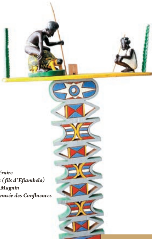
Poteau funéraire par Daloda (fils d'Efiambelo) Don André Magnin Collection musée des Confluences

Cette tête, en terre cuite, est le portrait posthume d'un chef agni. L'âme du défunt investissait la tête funéraire quand la cérémonie d'inhumation était terminée.