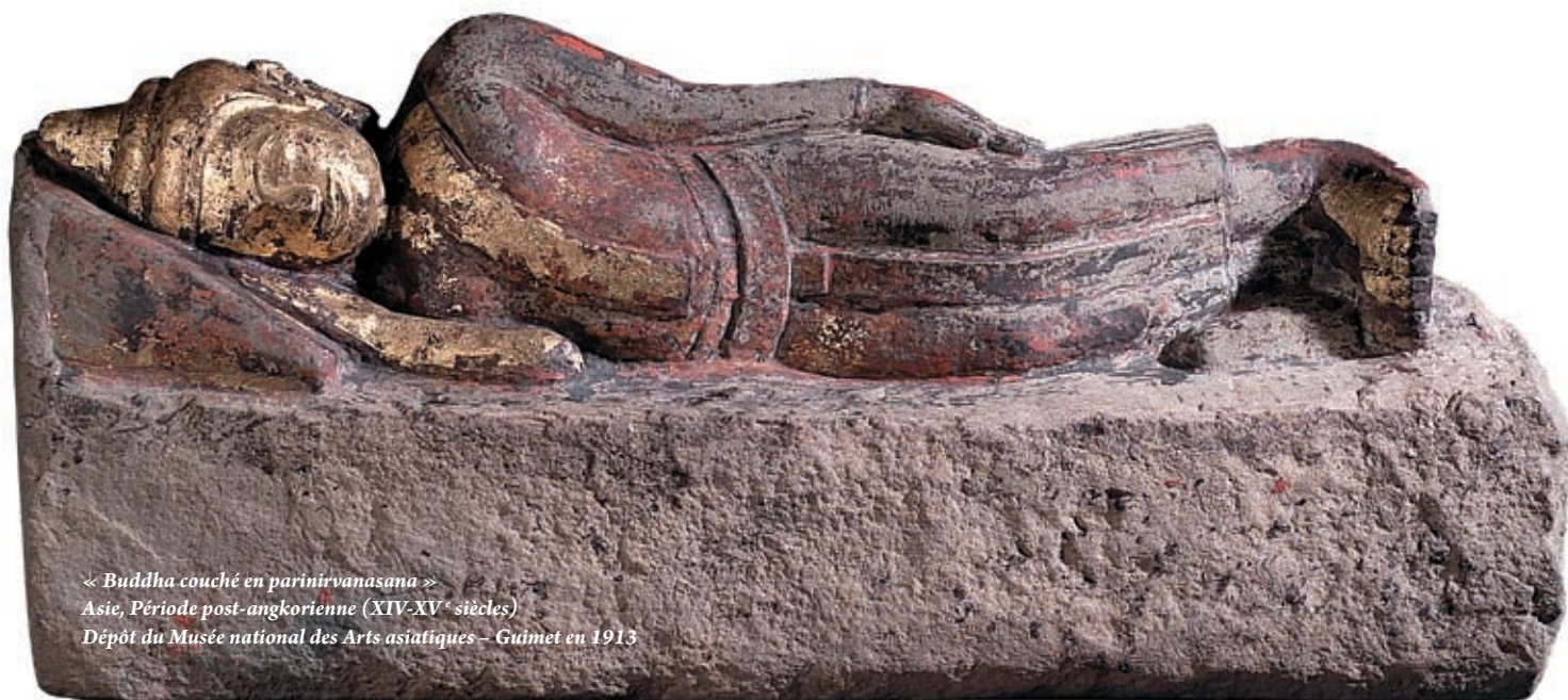
« Buddha couché en parinirvanasana » Asie, Période post-angkorienne (XIV-XV e siècles) Dépôt du Musée national des Arts asiatiques – Guimet en 1913