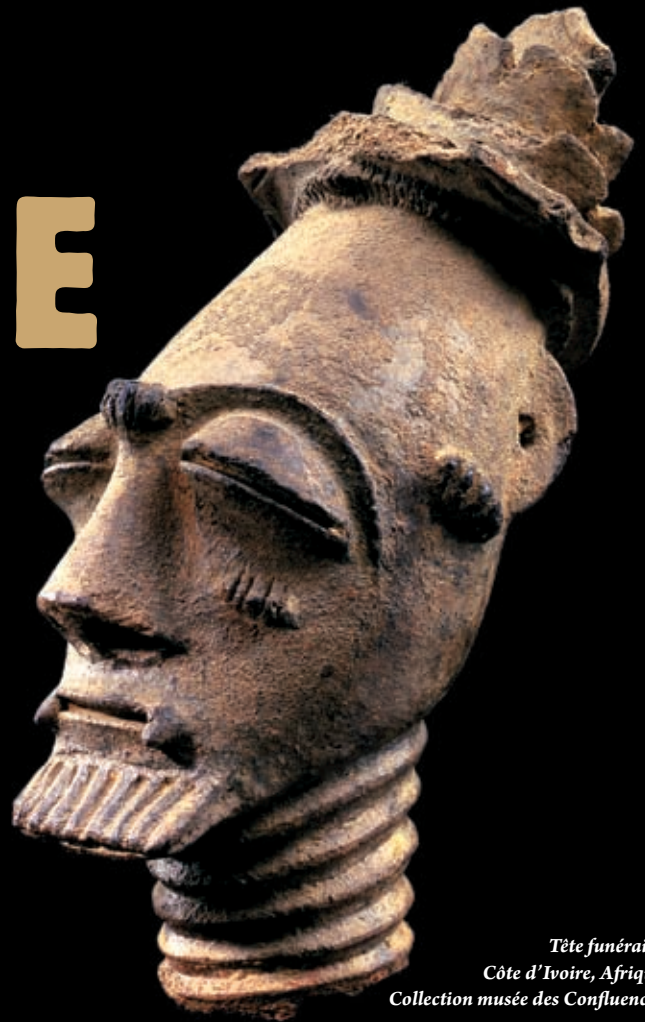
Tête funéraire Côte d'Ivoire, Afrique Collection musée des Confluences

Certaines sociétés du continent africain et de Madagascar continuent d'entretenir des liens avec leurs défunts. Ils les expriment à travers des objets qui révèlent des usages et des conceptions de la mort souvent considérée comme la destinée.