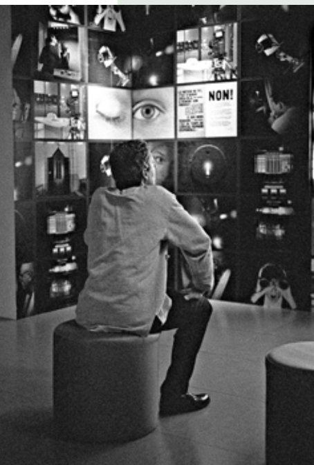
Exposition Ni vu ni connu . © Benoît Lapray (musée des Confluences).

En lien avec le projet scientifique et culturel, des expérimentations d'actions de diversification des publics sont mises en place. Ces directions de développement des publics sont renforcées par deux principes forts du projet, l'interdisciplinarité et l'interculturalité.