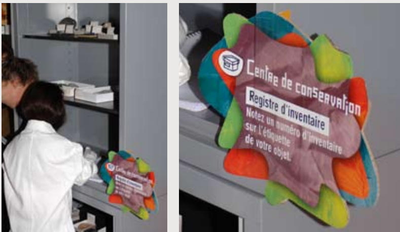
Espace découverte objets en transit .