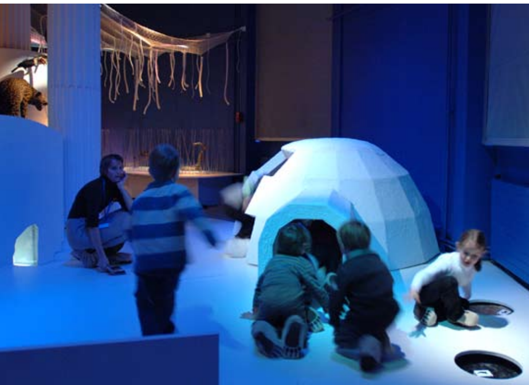
Exposition En route Petit Ours . Médiation jeunes publics.