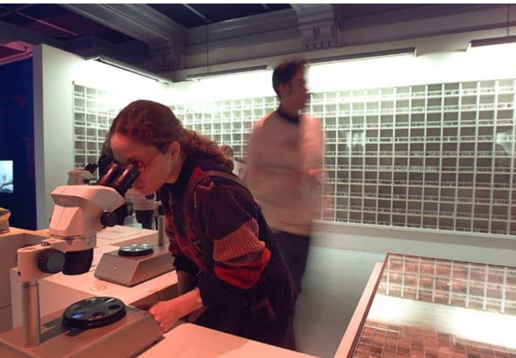
Exposition sable . © Patrick Ageneau (musée des Confluences).

Ces démarches font systématiquement l'objet d'une évaluation par le service spécialisé du musée. L'évaluation se fait à la fois auprès des publics et des médiateurs culturels pour tirer les fruits de ces expériences et permet d'adapter les outils après leur mise à l'épreuve.