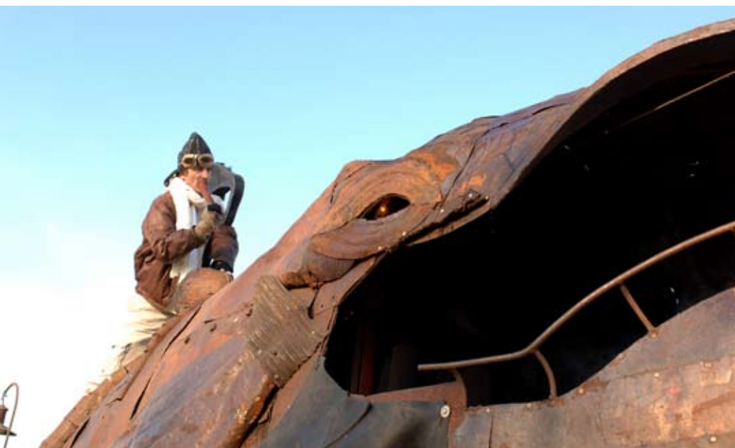
Festival [Label]Bêtes 2007 - La parade animale 2 - Compagnie Métalu à chahuter .

L'ensemble de ces publications contribue à positionner le musée comme lieu ressources de connaissances, où la multiplicité des approches sur un même sujet permet d'ouvrir l'esprit des lecteurs. La prise en compte de l'émergence d'une culture numérique et les nouvelles conditions de création, de diffusion et de consommation des œuvres et produits culturels, conduit l'institution à mener actuellement une réflexion visant à mettre en ligne ses ressources et ouvrages, dans une optique d'accessibilité à tous (charte d'accessibilité) sur le site Internet du musée.