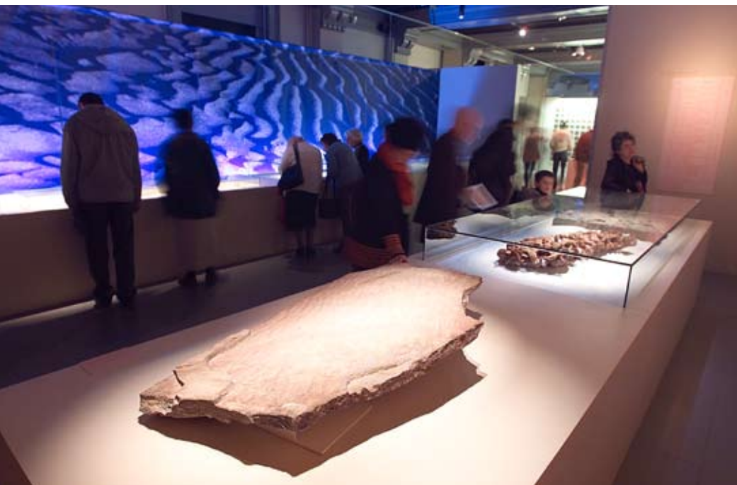
Exposition Sable . © Patrick Ageneau (musée des Confluences).