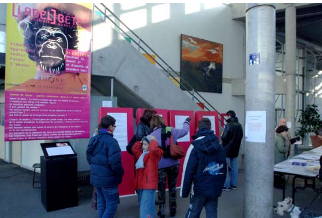
Festival [Label]Bêtes 2007 - L'accueil à la Cité Scolaire Internationale. © Patrick Ageneau (musée des Confluences).