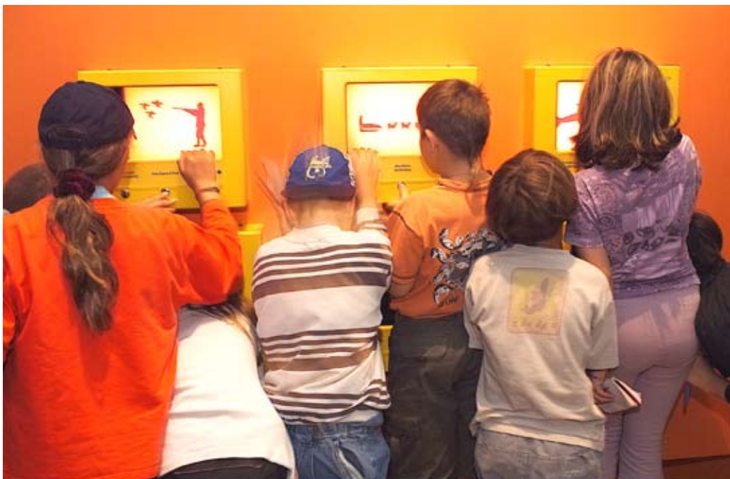
Exposition Inuit .

Les enjeux de son engagement conduisent le musée à travailler autrement, à élaborer de nouvelles relations avec les acteurs de la société et les publics prioritaires. La politique de partenariat engagée dans les musées depuis les années 90 a amené un véritable bouleversement. Les professionnels ne conçoivent plus une action pour les publics sans se poser la question de la concertation, de la négociation. Cette expérimentation permanente a été celle du Muséum, elle est celle du musée des Confluences. Elle induit une anticipation importante et une participation de représentants des publics dans la phase de connaissance et de conception des actions. Si, pour le musée des Confluences, c'est autour des points forts des collections d'entomologie et d'ethnologie que se dessinent des publics potentiels (publics curieux, amateurs, associations d'entomologie et communautés culturelles qui possèdent des objets significatifs), diversifier, c'est travailler avec d'autres publics et les prioriser. Quels sont ces « autres publics » ?