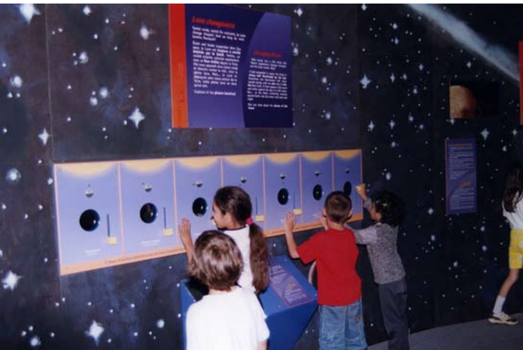
Exposition Lunes .

La constitution des échantillons dépend des spécificités des outils de mesure. L'outil qui demande le plus de précaution dans la constitution de son échantillon est le sondage. En effet, l'un des objectifs de cet outil de mesure est l'élaboration de la composition des publics. Par conséquent, les publics sondés doivent être représentatifs de l'ensemble des publics. Cette représentativité est basée sur des critères liés aux périodes de fréquentation (quotidienne et saisonnière) et à la participation à une médiation culturelle (20 % des publics participent à une médiation). De plus, chacun des visiteurs est sollicité individuellement. Enfin, le discours des enquêteurs, la remise d'une affiche, ainsi que l'aménagement d'un espace approprié incitent largement les publics à répondre au questionnaire. Pour les entretiens, les échantillons sont aléatoires, tout en visant une hétérogénéité de profils.