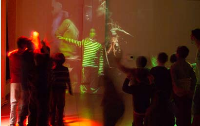
Installation interactive Ni vu ni connu .