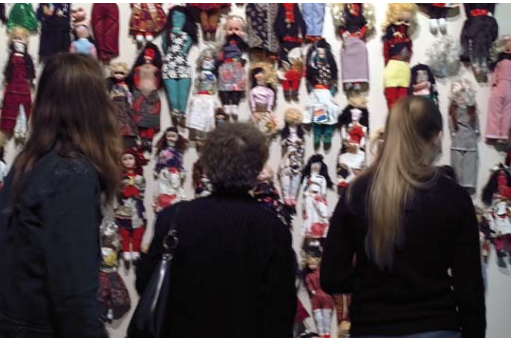
Exposition À vous de jouer , œuvre de Jorge Pinéda. © Patrick Ageneau (musée des Confluences).