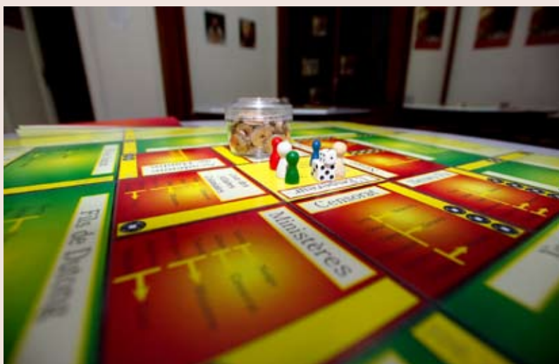
Atelier Jeux Chinois . Exposition Dieux de Chine .

Un jeu traditionnel chinois sur la promotion des mandarins, le Shing Kun T'o, a permis aux publics de tout âge de découvrir la structure de l'administration impériale et certaines de ses particularités. Ce jeu, élaboré par les médiateurs, est une adaptation simplifiée et en partie une re-création du jeu traditionnel chinois du XIXe siècle. Il conserve les mêmes principes de fonctionnement avec une structure allégée. Il s'agit d'un jeu de type « jeu de l'oie » où les participants incarnent des personnages tentant, au cours de leur existence, de s'élever dans la hiérarchie impériale.