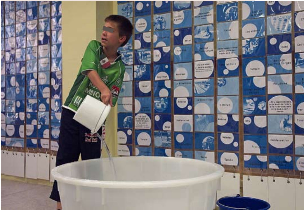
Légende jeu « s-eau-s » dans le cadre de l'exposition Eau pour tous .

culturelles et professionnelles. En mars 2006, une première collecte a lieu auprès de chaque « groupe identitaire ». Des anecdotes et des objets caractéristiques de la relation avec le quartier sont recueillis. Fin 2006, cinq photos d'objets sont diffusées dans le quartier. Les habitants sont invités à raconter des anecdotes, réelles ou imaginaires, en lien avec ces objets, d'en faire leur propre interprétation.