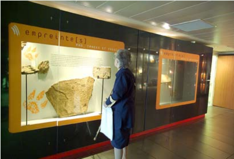
Exposition Empreintes .

l'efficacité de la pratique médicale. Le fait d'exposer des collections du Muséum à l'hôpital ne pourrait-il pas contribuer à décentrer les identités ?