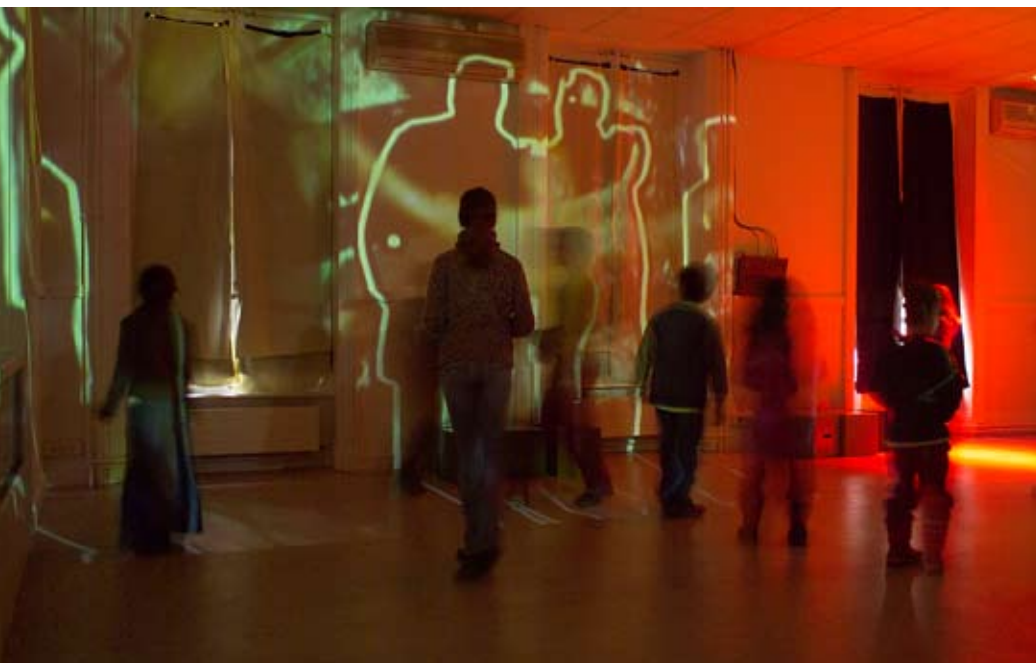
Espace découverte « Ni vu ni connu » ( Interactifs ).