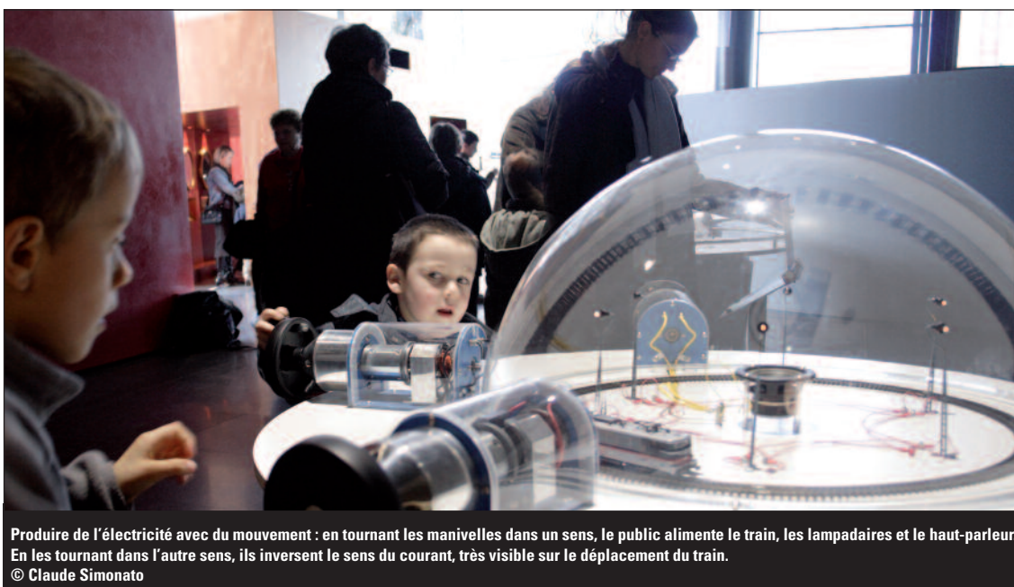
Produire de l'électricité avec du mouvement : en tournant les manivelles dans un sens, le public alimente le train, les lampadaires et le haut-parleur. En les tournant dans l'autre sens, ils inversent le sens du courant, très visible sur le déplacement du train.