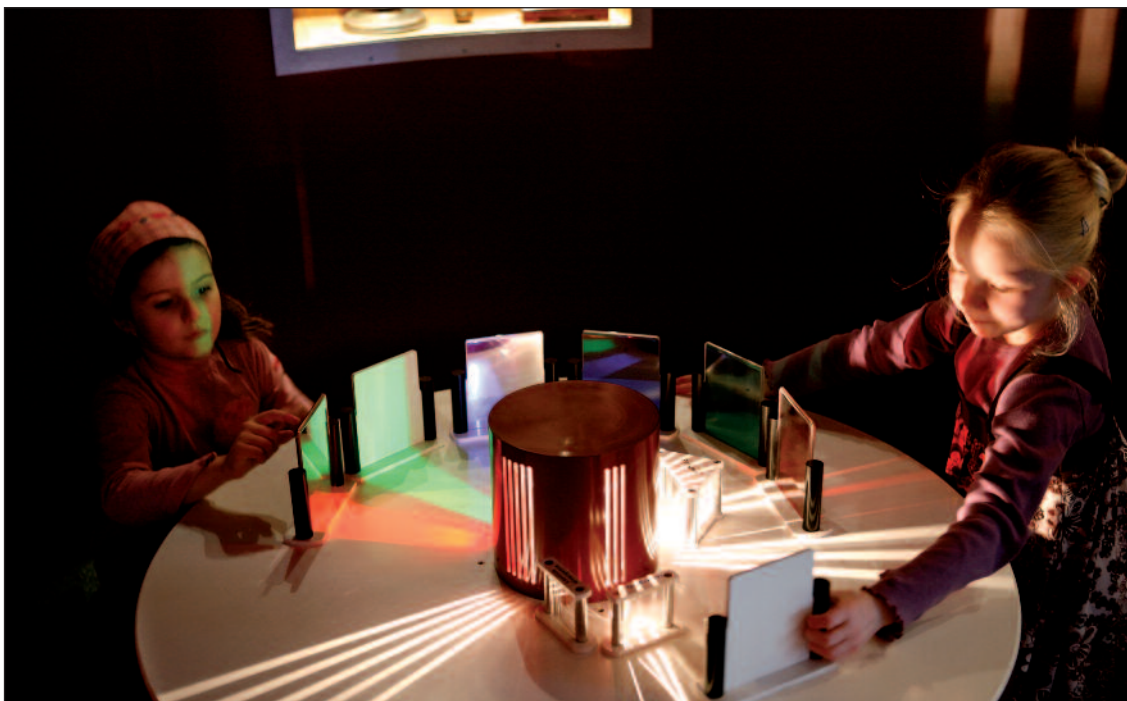
La table des couleurs ou comment décomposer la lumière blanche en arc-en-ciel avec un prisme.

En valeur absolue, l'évolution de la composition socio-professionnelle du public de l'Espace des sciences apparaît autrement plus spectaculaire quand on sait que sa fréquentation annuelle est passée, pour les visiteurs des expositions, de quelque 40 000 entrées annuelles à