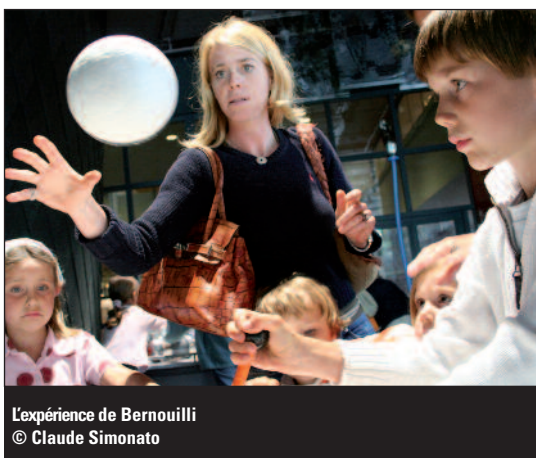
L'expérience de Bernoulli © Claude Simonato