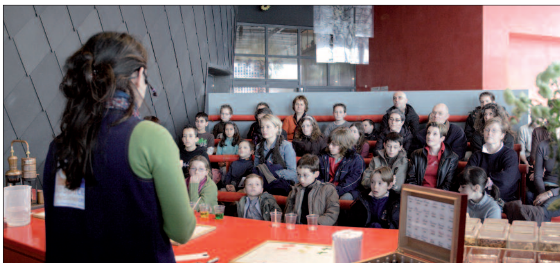
Les animations scientifiques sont présentées par des médiateurs et sont suivies par un public familial

La liste des expositions présentées au centre Colombia, de 2000 à 2005, rend compte de la diversité des sujets abordés. Toutes ces expositions ont été évaluées dans le cadre de l'Observatoire permanent des publics mis en place par le cabinet d'études ARCMC.